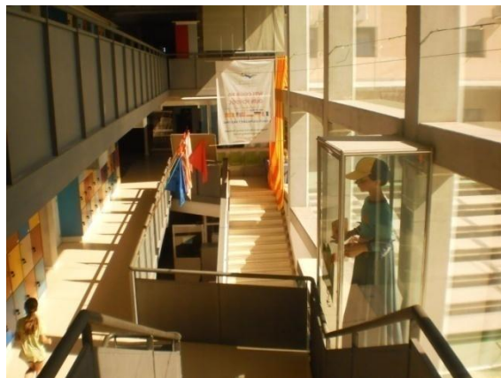
Vue sur le hall d'entrée