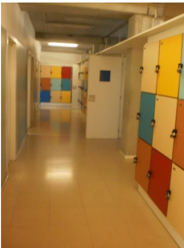
Chaque élève possède un casier.

Cette école est très jolie et son fonctionnement est complètement différent des écoles françaises. Les élèves peuvent sortir de la classe pour faire des photocopies ou bien tout simplement prendre l'air. Leur mentalité est complètement différente.