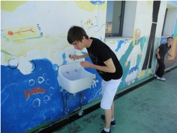
Un cours de musique