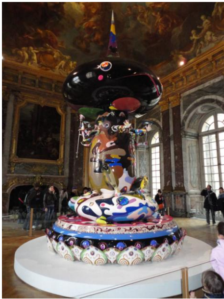
Exposition Takashi Murakami