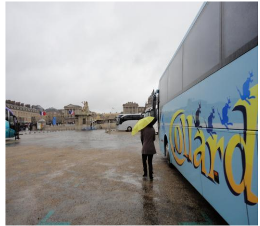
Tiens ! Tiens ! Qui se cache sous ce parapluie ?